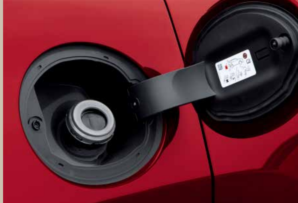
CAPLESS FUEL FILL 손을 더럽힐 필요없이 누르기만 하면 쉽게 주유구가 열려 주유가 안전하고 신속해집니다.