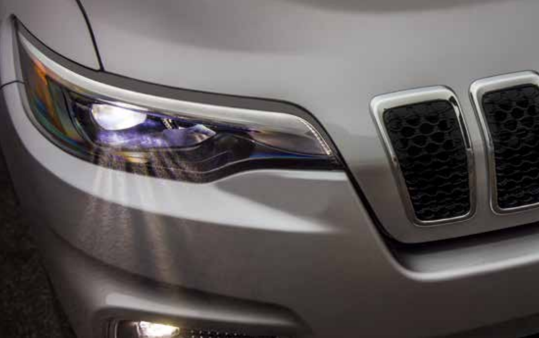
LED HEADLAMPS 어두운 밤에도 더 멀리 전방 도로를 볼 수 있습니다.